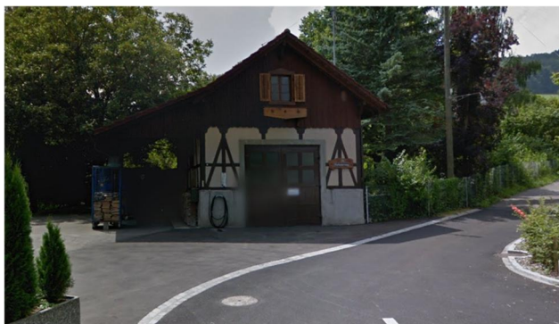
Abbildung 8: Wohnhaus 19a, Google Street View, 2014