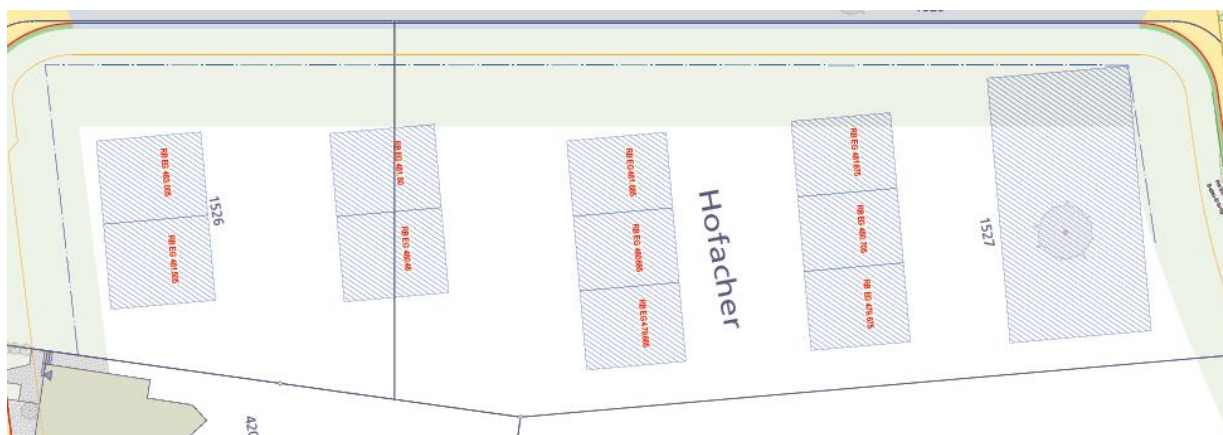
Abbildung 1: Übersicht geplantes Bauprojekt auf dem Hofacher

Auf den Parzellen Nr. 1505, 1525, 1526 und 1527 bestehen Bauabsichten. Ein konkretes Baugesuch wurde auf den Parzellen Nr. 1526 und 1527 bereits eingereicht. Die Strassenparzelle Nr. 1529 befindet sich im Privatbesitz. Die Grundeigentümer möchten im Zusammenhang mit der neuen Überbauung die Privatstrasse realisieren und später an die Gemeinde Niederdorf abtreten.