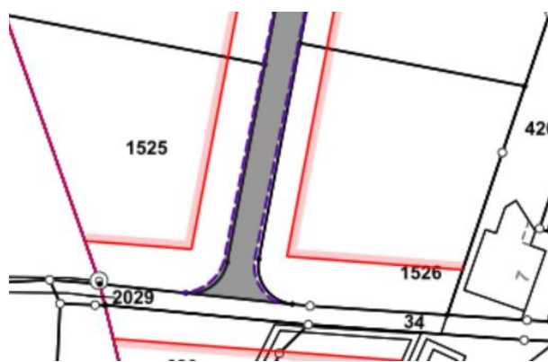
Abbildung 2: Abweichung mit Parzellenmutation 2021/2022